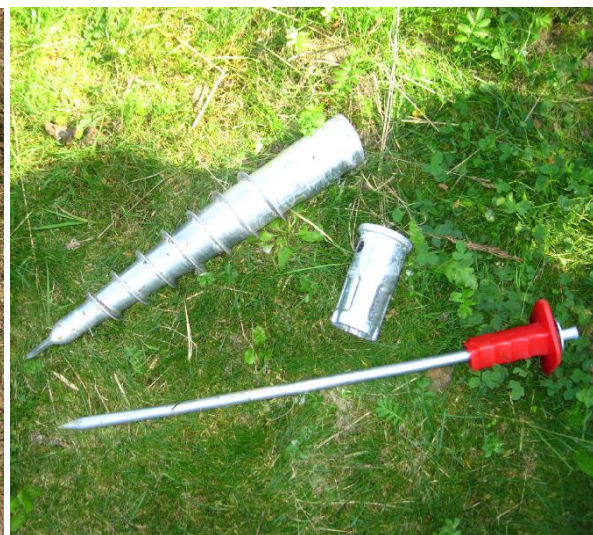
patka, zatlkacia kolík, zemná skrutka