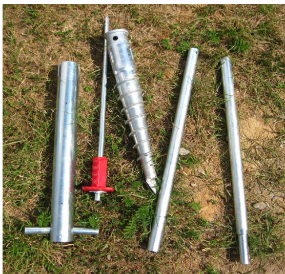
inštaláčny križ, zatlkacia kolík, zemná skrutka